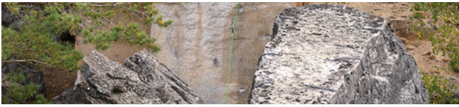
Hugo Rein dans Gurudrome

Grimper : Comment un site si confidentiel s'est-il retrouvé avec un topo aussi moderne et complet ?