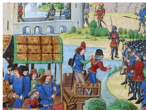
ANECDOTE LE DÉPART D'UNE RÉVOLTE : LA JACQUERIE