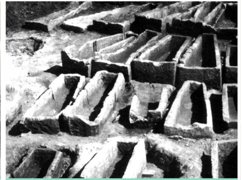
ANECDOTE UNE NÉCROPOLE MÉROVINGIENNE À MONTATAIRE