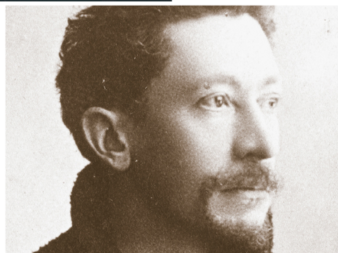
ANECDOTE OUI, LES GALLÉ-JUILLET ONT UN LIEN AVEC ÉMILE GALLÉ