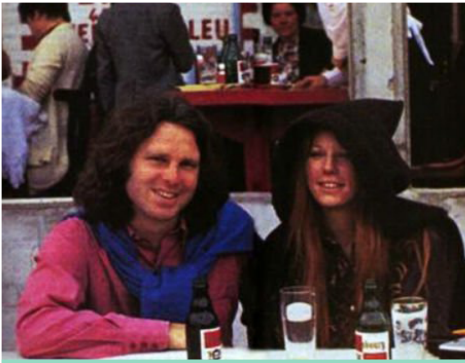
ANECDOTE JIM MORRISSON, DE PASSAGE À SAINT-LEU-D'ESSERENT