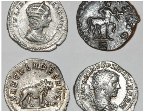
ANECDOTE DE LA SORTIE DE CLASSE AU TRÉSOR GALLO-ROMAIN