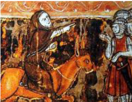
ANECDOTE PIERRE, ERMITE EN 1090