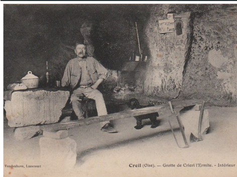
ANECDOTE CRICRI, L'ERMITE QUI DEVINT CÉLÈBRE