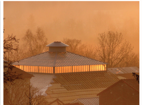
ANECDOTE L'USINE QUI DEVINT APARTEMENTS