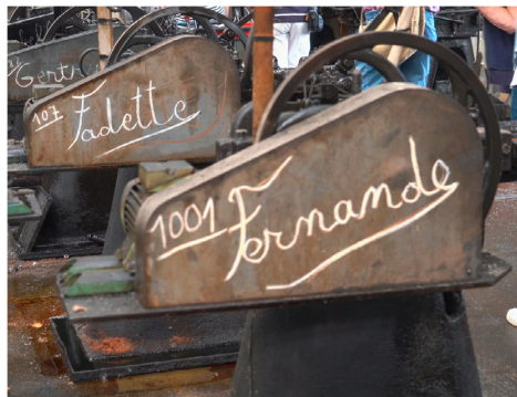
ANECDOTE LES MACHINES QUI AVAIENT UN PRÉNOM