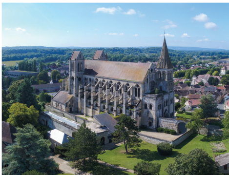
ANECDOTE L'ABBATIALE QUI ÉTAIT UNE PRIEURALE