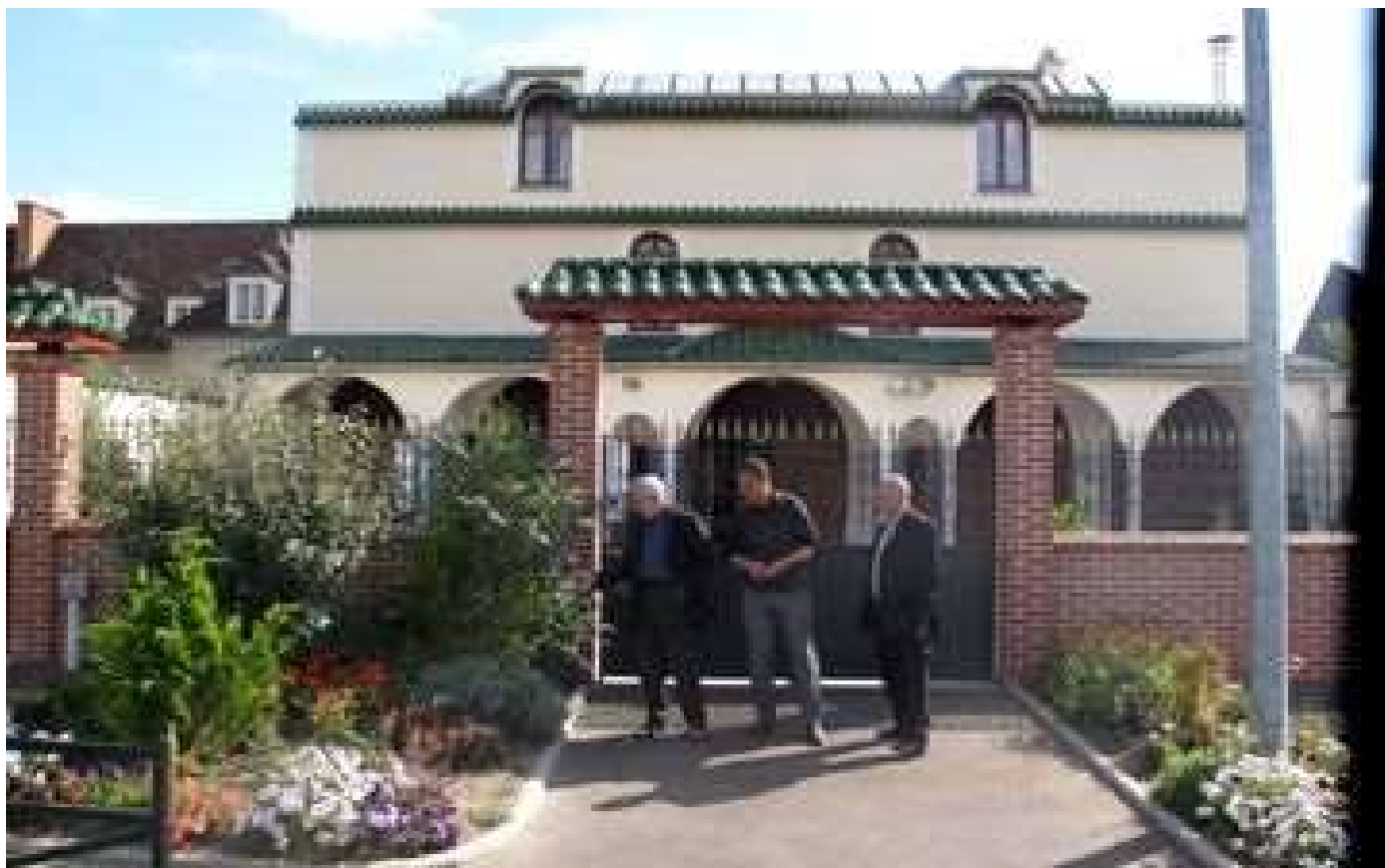
Abonnés Oise : trop à l'étroit, les lieux de culte musulmans à l'heure des grands travaux