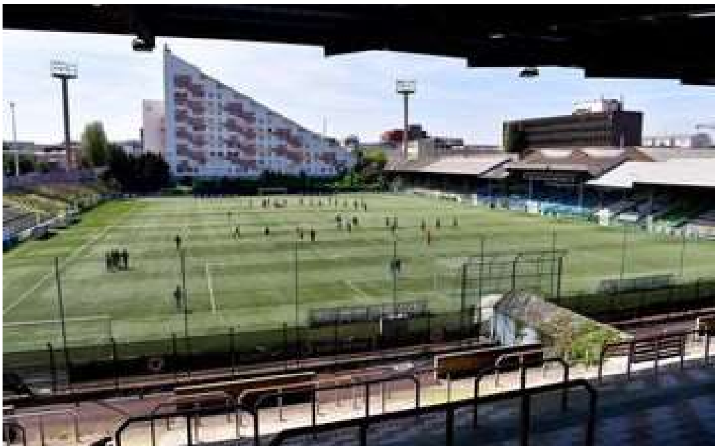
Abonnés A Saint-Ouen, le stade Bauer va enfin s'appeler officiellement... stade Bauer