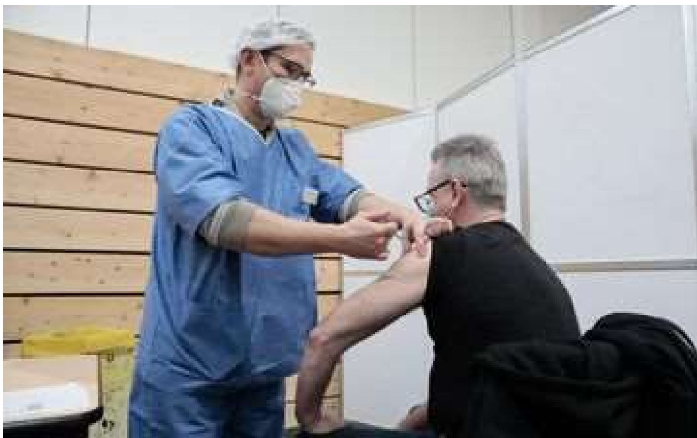
Moderna, AstraZeneca... La campagne de vaccination s'accélère enfin dans l'Oise