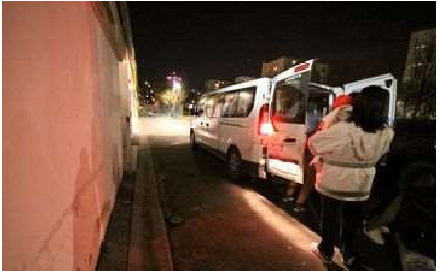
Seine-et-Marne : le préfet renforce le Plan Hiver à l'approche d'une vague de grand froid