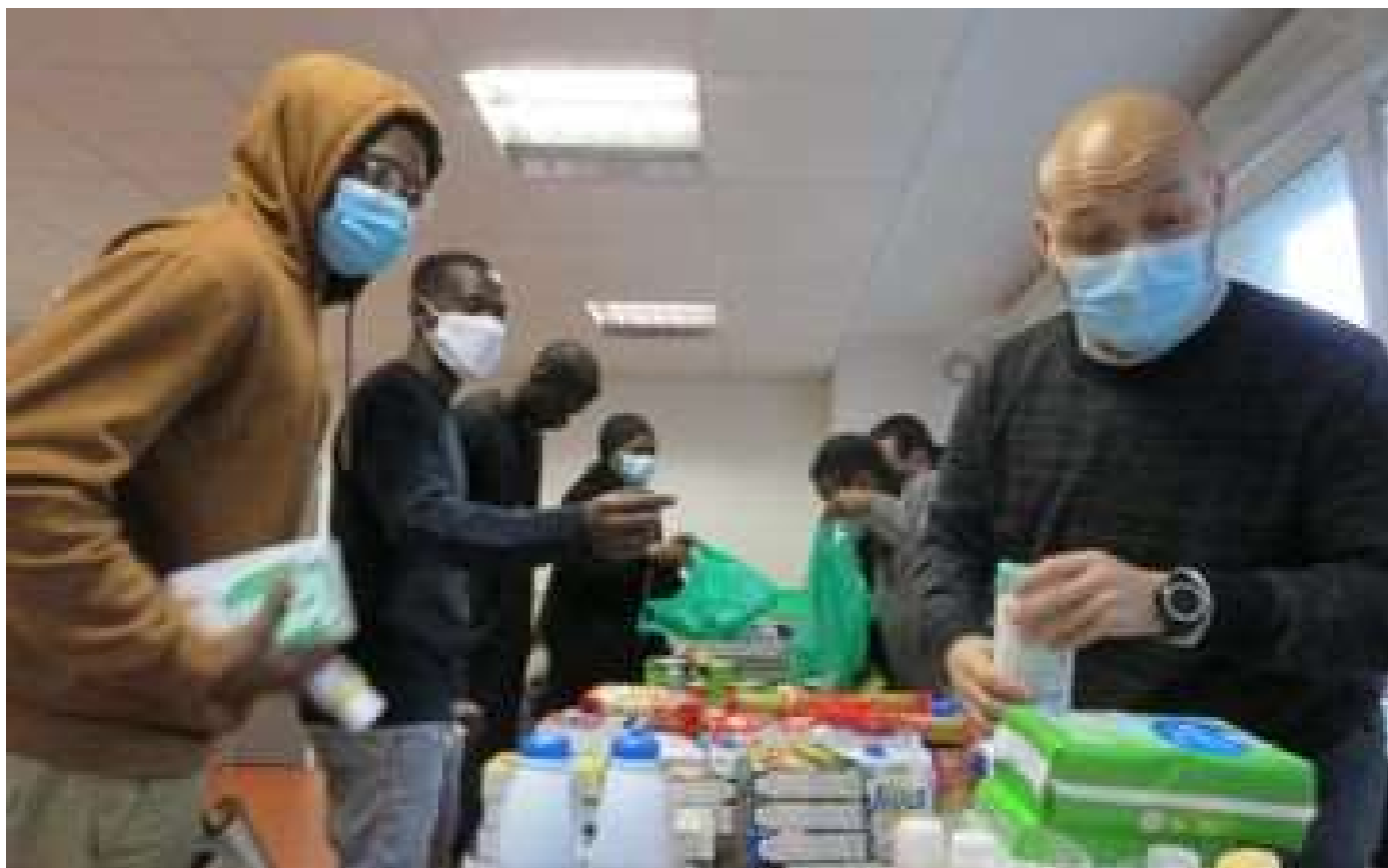
Dans l'Oise, l'aide alimentaire s'intensifie pour les étudiants dans le besoin