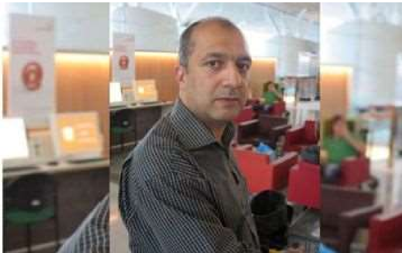
Abonnés Réouverture de la mosquée de Pantin : le recteur dans le viseur de la préfecture